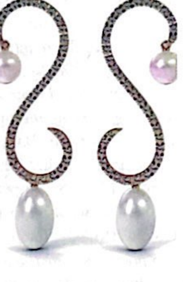
Boucles d'oreilles en or rose, diamants et perles de culture, 6 250€, ISABELLE LANGLOIS