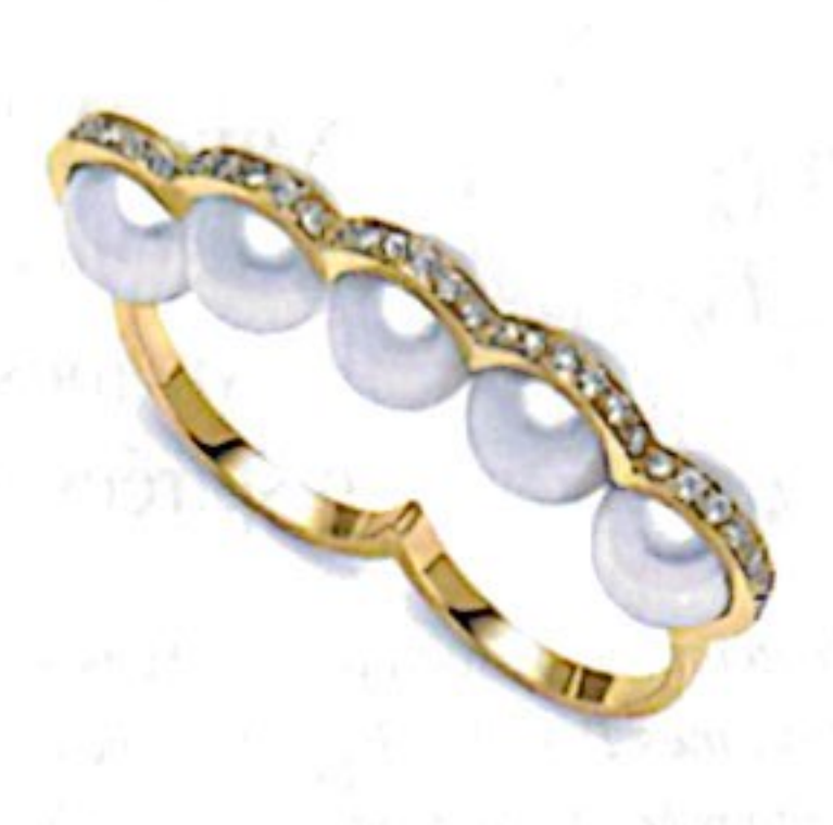
Double bague Sporting, or jaune, diamants et perles, 5 100 €, PORCHET