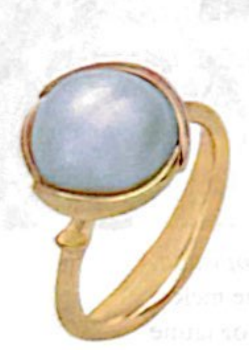
Bague Lotus, or jaune et perle, 4900 €, OLE LYNGAARD