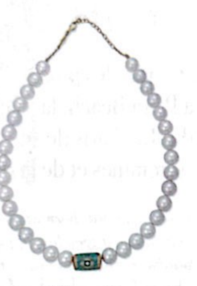
Collier, perles, turquoise, or jaune, prix sur demande, JACKIE AICHE