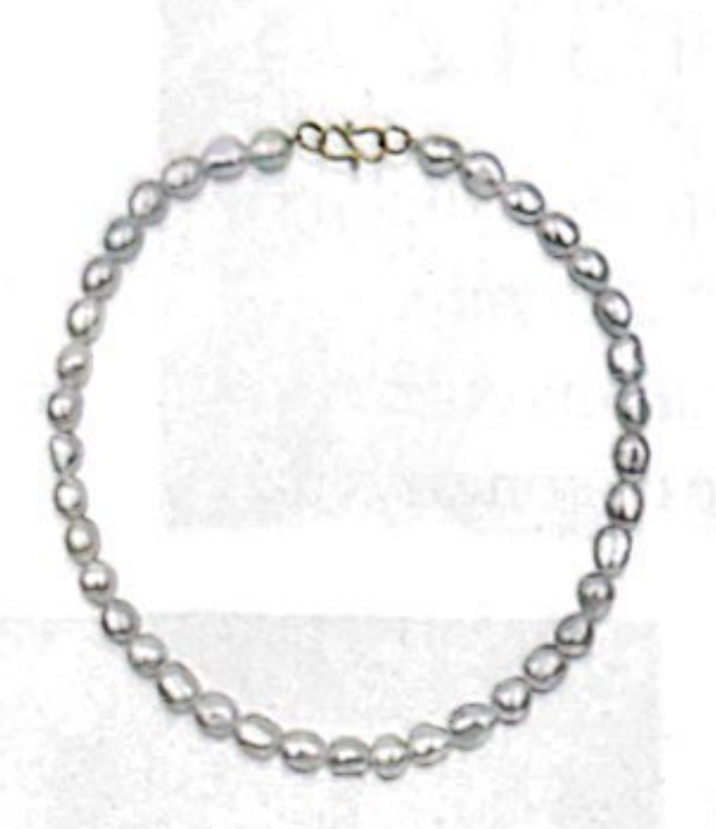
Collier Inès , perles baroques, 135 €, DAPHINE

Bijou fétiche des Françaises, la perle se griffe cette saison sur nos tenues estivales. En pendentif, en accumulation ou en ras-du-cou, au poignet en mono-perle ou total look, en bague, en boucles d'oreilles, en versions ronde ou plate... on n'hésite pas à marier les styles!