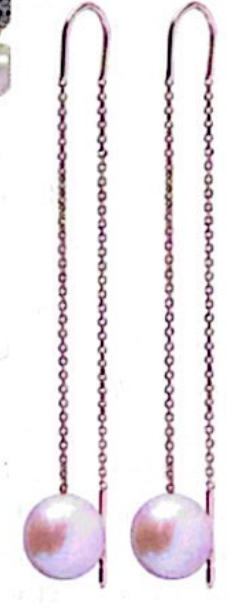
Boucles d'oreilles, perles, 390 €, GALERIES LAFAYETTE LA JOAILLERIE