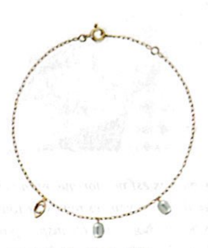
Chaîne de cheville, or jaune et perles d'eau douce, 410 €, CHARLET