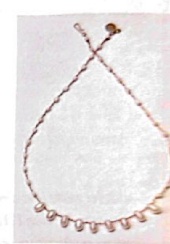
Collier Bird, perles d'eau douce allongées et gouttes, 230 €, IVARENE