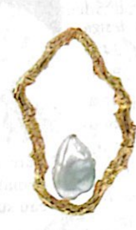
Boucles d'oreilles Brindille, perle baroque et laiton doré à l'or fin, 195 €, IMAÏ